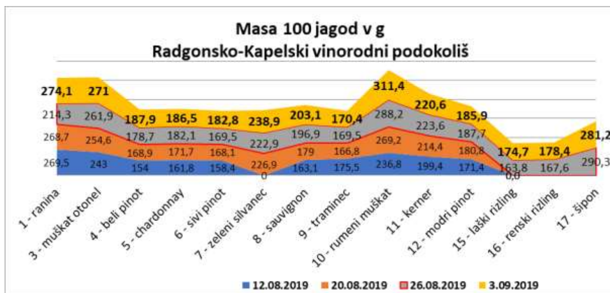
Graf 1: Spremljanje dozorevanja grozdja letnika 2019: Povprečna masa 100 jagod grozdja v Radgonsko Kapelskem vinorodnem podokolišu