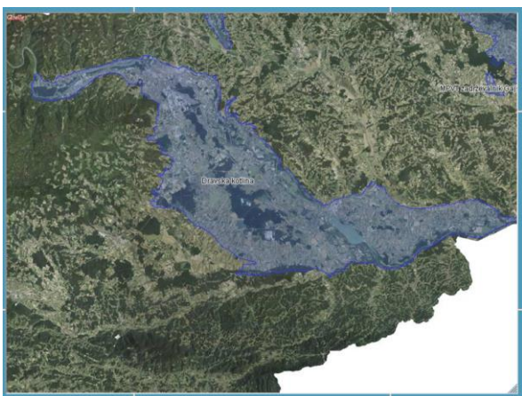
Slika 1. NUV-D Dravska kotlina.