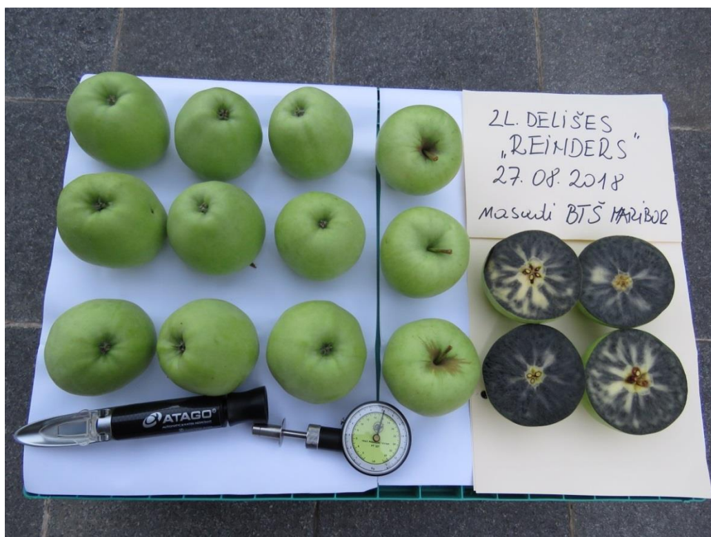
Obiralno okno zl. delišes klon reinders v nasadih BTŠ Maribor, med 8. in 13. 09. 2018 (vsi parametri tehnološke zrelosti idealni).